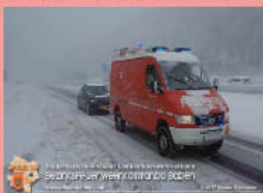
Tödlicher Verkehrsunfall auf der A21