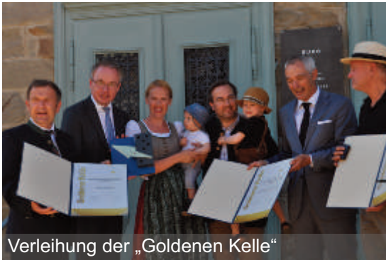
Verleihung der „Goldenen Kelle“

Somit können wir mit dem letzten Abschnitt des Radweges (Ortsgebiet Sattelbach) beginnen. Demnächst wird hier den Anrainern der Plan für die Ortsraumgestaltung mit Radweg vorgestellt.