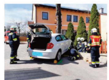
VU mit einer verletzten Person