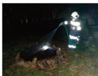
Nachlöscharbeiten infolge Lagerfeuer in Waldnähe