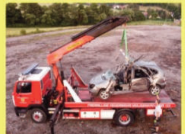
Einsatzübung: Menschenrettung nach Verkehrsunfall