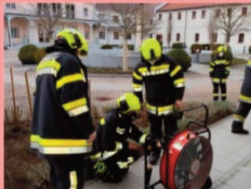
Auslösung der Brandmeldeanlage Hochschule Heiligenkreuz durch ein defektes Entfeuchtungsgerät