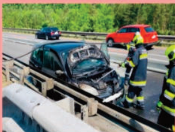
Fahrzeugbrand auf der A21