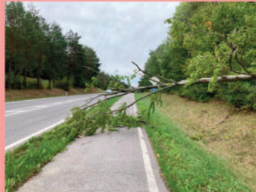
Baum über Straße B11 >> Gaaden