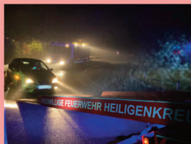
Fahrzeugbergung B11 >> Alland