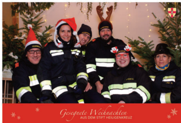
Die Mitglieder der FF Heiligenkreuz wünschen frohe Weihnachten und einen guten Rutsch ins Jahr 2023

Mit einem letzten "Gut Wehr" möchten wir uns verabschieden und Danke sagen, für die vorbildhafte Kameradschaft und den geleisteten Einsatz für unsere Wehr! RUHE IN FRIEDEN!