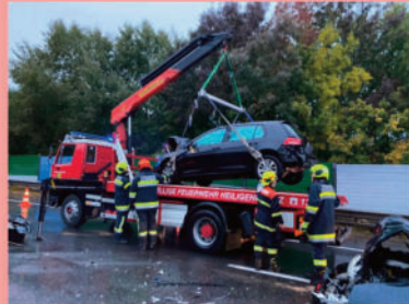
Verkehrsunfall auf der A21