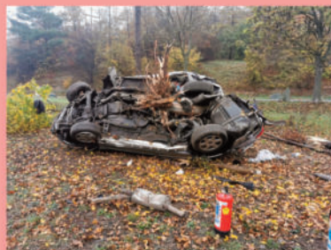
Menschenrettung nach schwerem Verkehrsunfall auf der A21