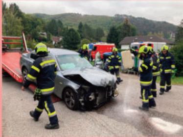
Verkehrsunfall L130 Hofwiese