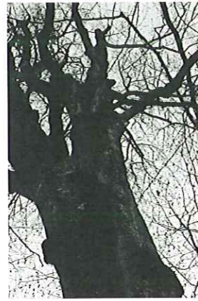
Ein vom Umstürzen bedrohter Baum entlang des „Wegerls im Helenental“.

Purkersdorf, am 23. Februar 2011. In der ersten Märzwoche werden am „Hohen Lindkogel“ entlang des Wanderweges im Bereich der Cholerakapelle absterbende und vom Umstürzen bedrohte Bäume im Hangbereich entfernt. Aufgrund der Schlägerungsarbeiten ist der betroffene Teilbereich des „Wegerls im Helenental“ für etwa drei Wochen gesperrt. Diese Maßnahmen sind notwendig, um die gefahrlose Benützung des Weges durch die BesucherInnen auch weiterhin zu gewährleisten.