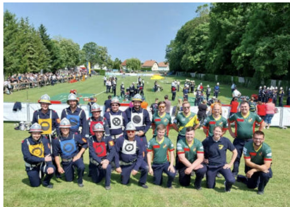
Heiligenkreuz 1 und Heiligenkreuz 2 beim AFLB in Deutsch-Brodersdorf

Heuer finden die NÖ Landesfeuerwehrleistungsbewerbe nach über 30 Jahren wieder im Bezirk Baden, nämlich von 30.6. - 02.7. in Leobersdorf statt. Aus diesem Anlass werden heuer gleich zwei Bewerbungsgruppen aus Heiligenkreuz daran teilnehmen.