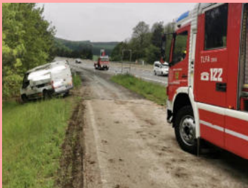
Verkehrsunfall auf der A21