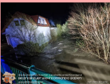
Überwachung Hochwassersituation Sattelbach und Schwechatfluss