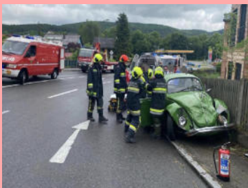
Menschenrettung nach Verkehrsunfall im Ortsgebiet