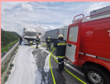
LKW-Brand auf der A21