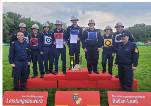
Siegerehrung beim Leistungsbewerb in Günselsdorf

Wir wünschen viel Erfolg beim NÖ Landesfeuerwehrleistungsbewerb in Leobersdorf!